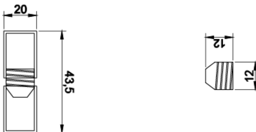
Fig. 1 Disegni quotati